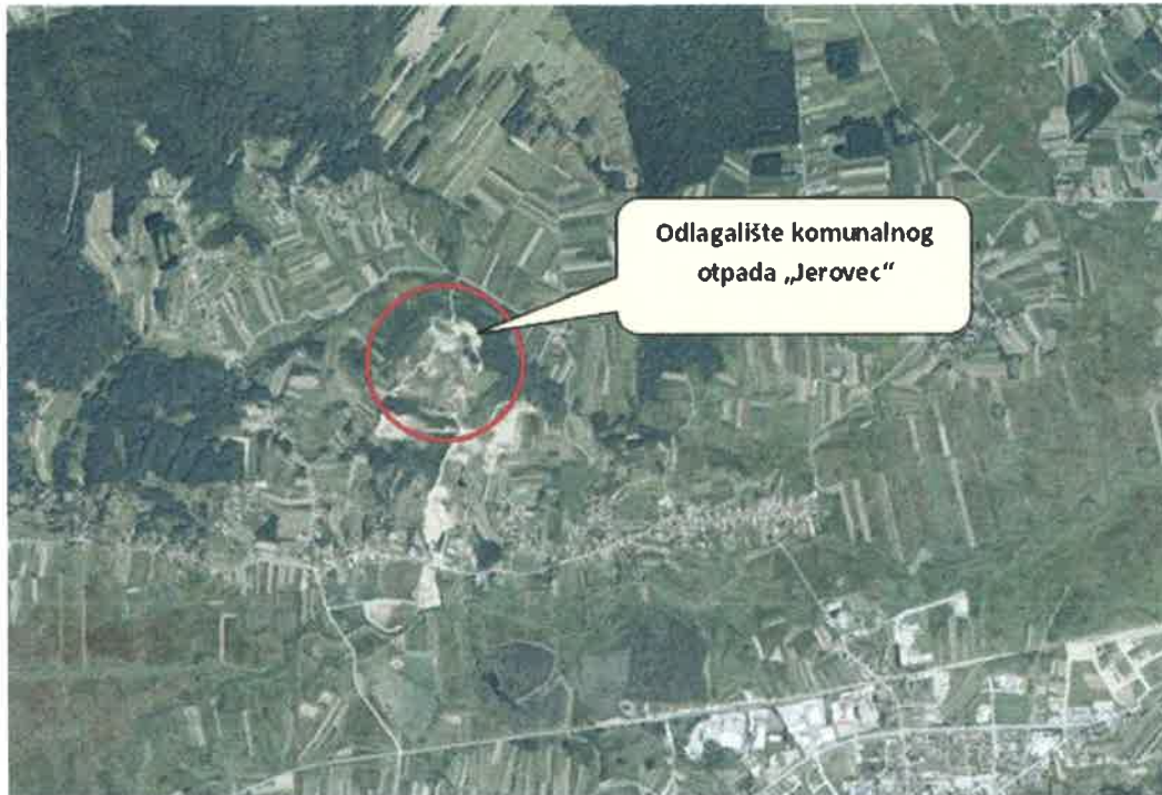
Slika 1. Položaj odlagališta „Jerovec“ u odnosu na okolna naselja