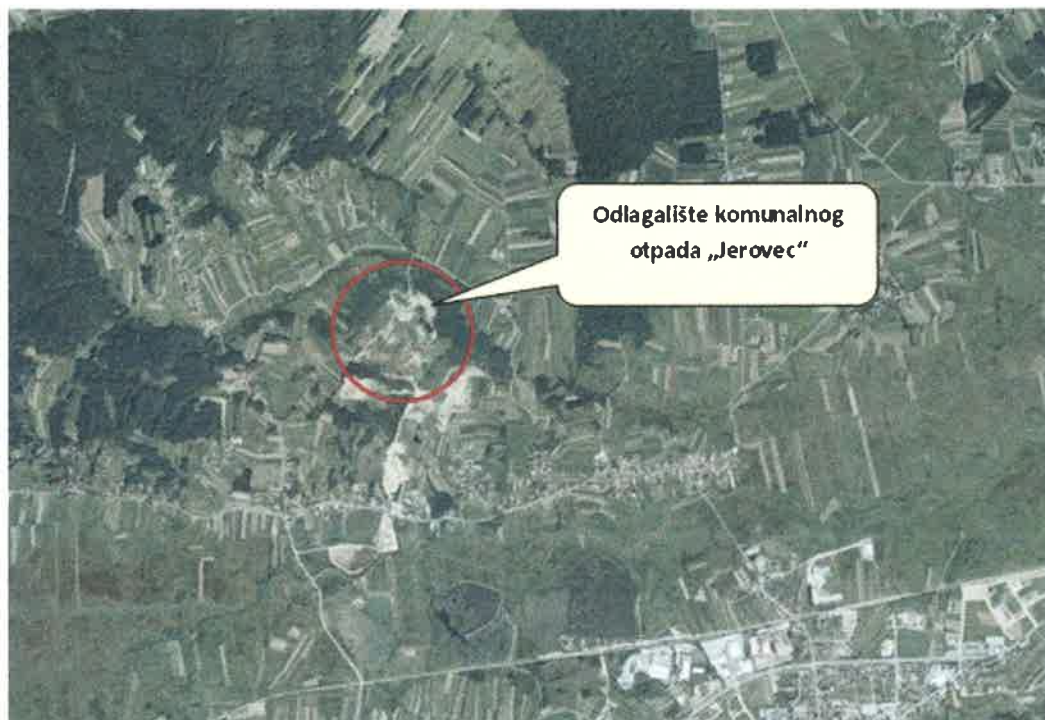
Slika 1. Položaj odlagališta „Jerovec“ u odnosu na okolna naselja

Slike 1 i 2 prikazuju smještaj odlagališta otpada „Jerovec“ i smještaj pripadajućih plinskih bunara.