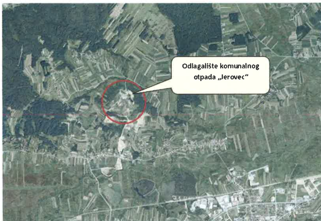
Slika 1. Položaj odlagališta „Jerovec“ u odnosu na okolna naselja

Slike 1 i 2 prikazuju smještaj odlagališta otpada „Jerovec“ i smještaj pripadajućih plinskih bunara.